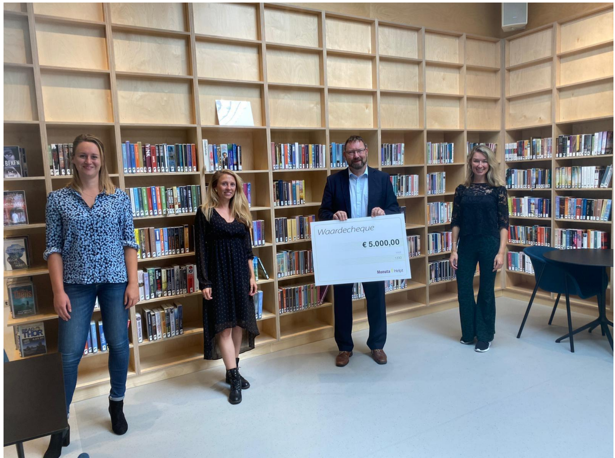
Foto: Uitreiking Stichting 1330